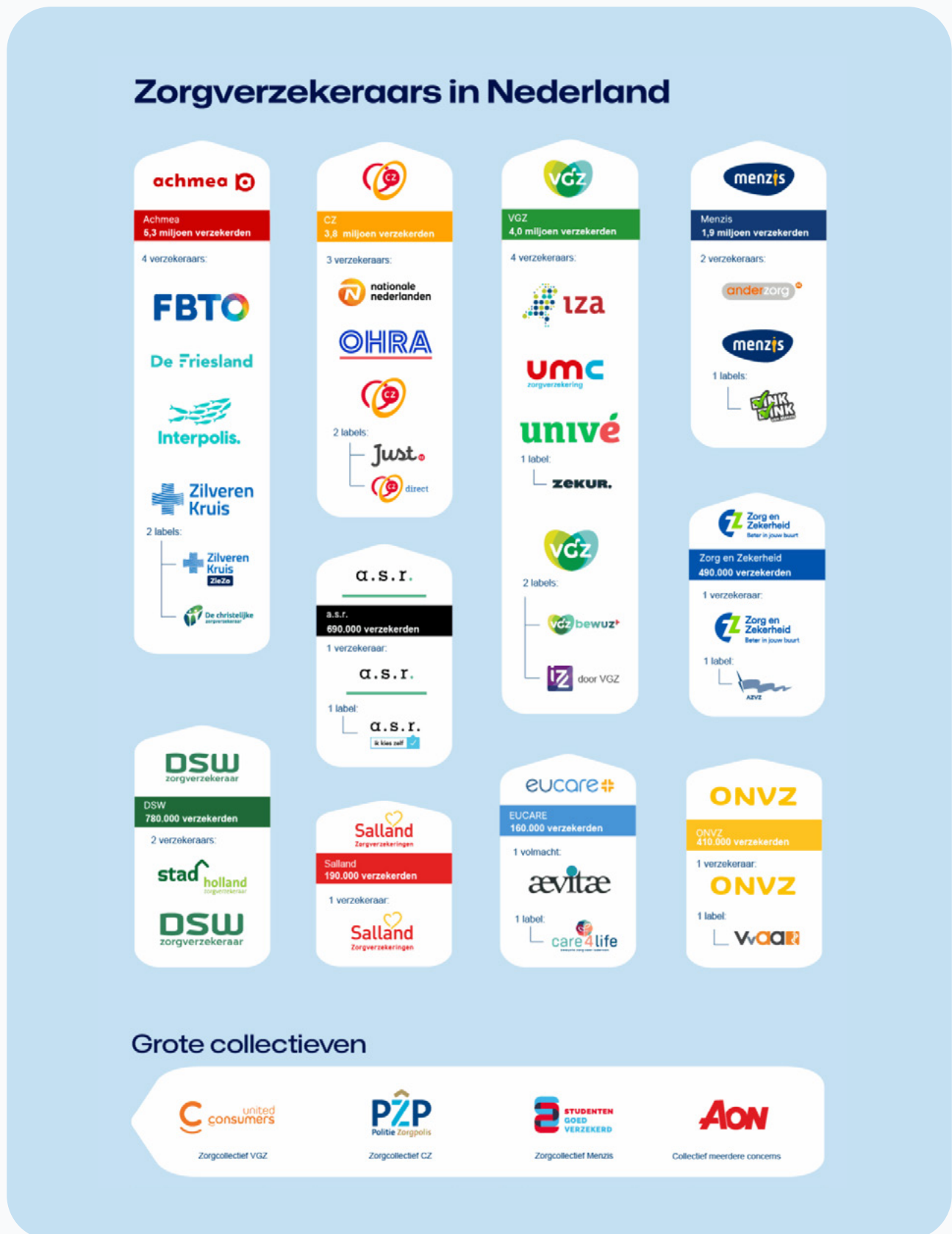
Figuur 3: concerns en de bijbehorende onderliggende verzekeraars en labels voor 2026 (Bron: Zorgwijzer , 2026)