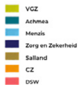
Grootste concern per gemeente

Het grootste concern per gemeente: dit beeld blijft door de jaren heen nagenoeg hetzelfde. Concerns die niet worden getoond zijn in geen enkele gemeente het grootste.